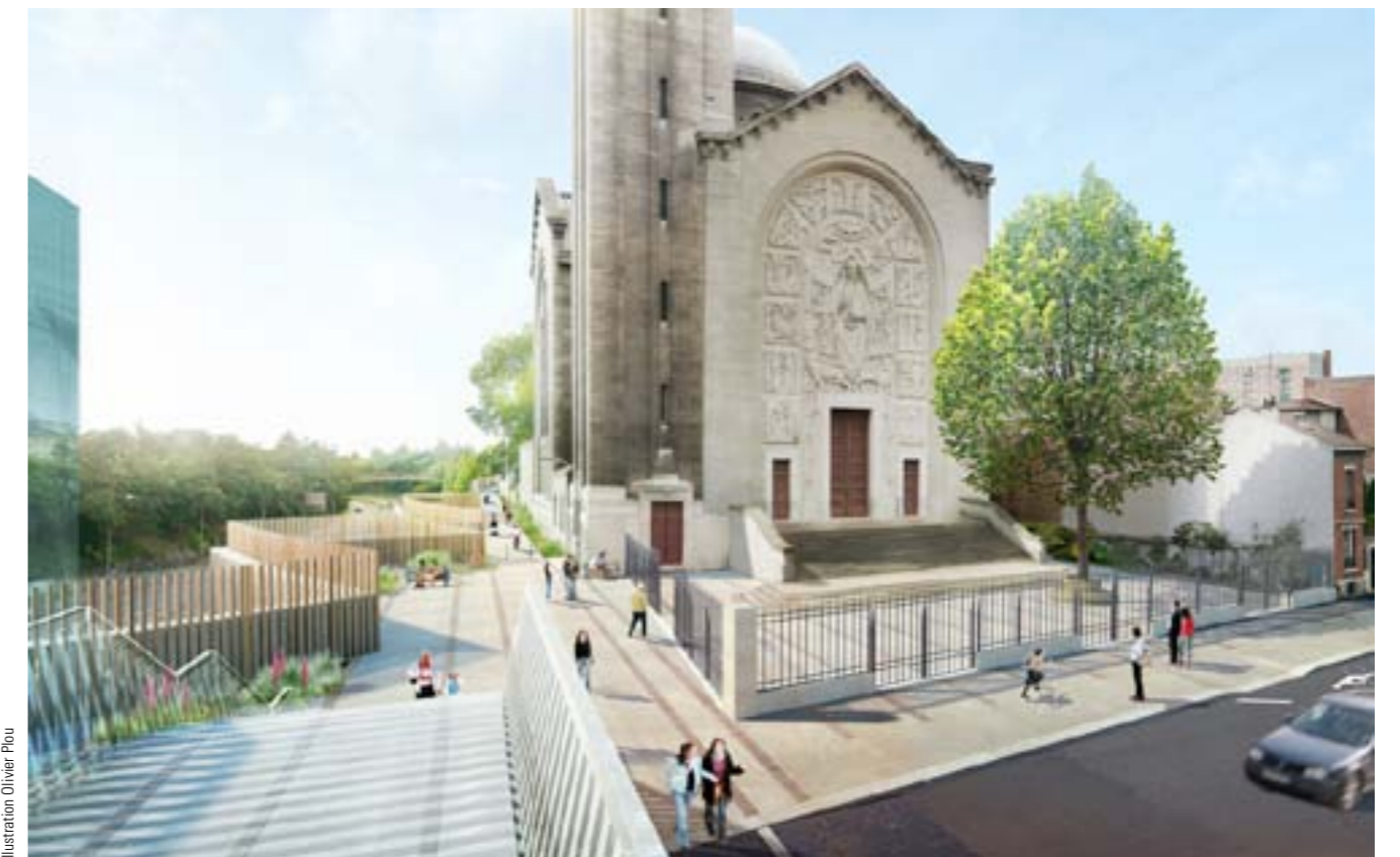
illustration Olivier Ploeu

Elle constitue à ce titre une séquence urbaine cohérente et lisible permettant de rejoindre la vallée de la Bièvre vers le Sud.