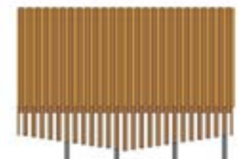
type 1: claire-voie doublé de mur anti-bruit + banc

L'économie des déplacements liés à l'approvisionnement du chantier, les structures de chaussées, les terres et les gravas sont stockés puis réutilisés voir sur place, une réflexion sur l'économie de l'approvisionnement des matériaux du chantier, sur des temps de chantiers courts, sur le confort et la sécurité des ouvriers.