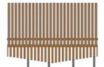
type 2: claire-voie doublé de maille + banc