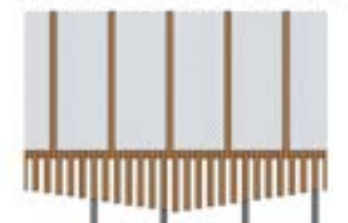
type 3: ajouré doublé de maille