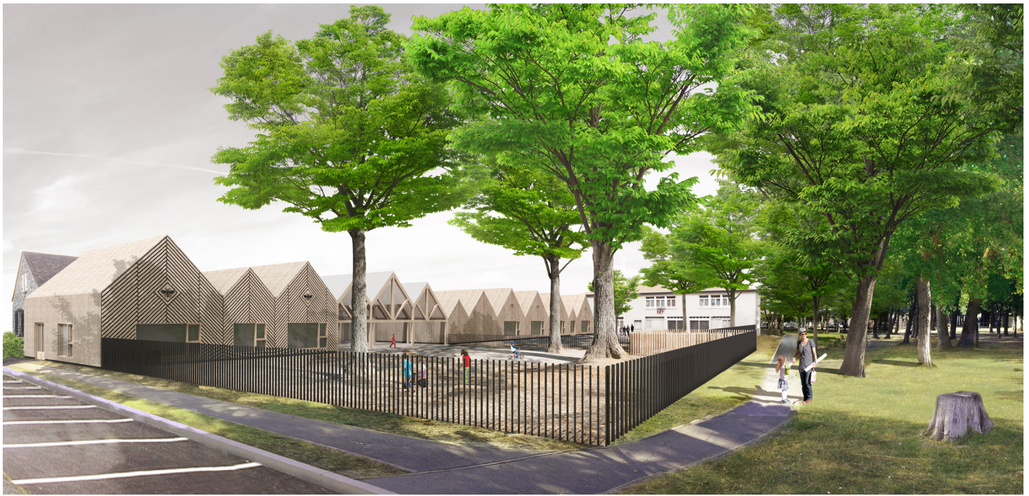
PERSPECTIVE DEPUIS LE CHEMIN DE LA GUINGUERE