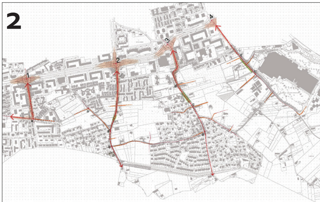
Un projet avec un minimum de voiries

La trame parcellaire agricole historique a été malmenée par les grandes opérations d'urbanisme des 50 dernières années. Le projet se développe dans la trame des haies et sur ce parcellaire étroit si particulier et typique.