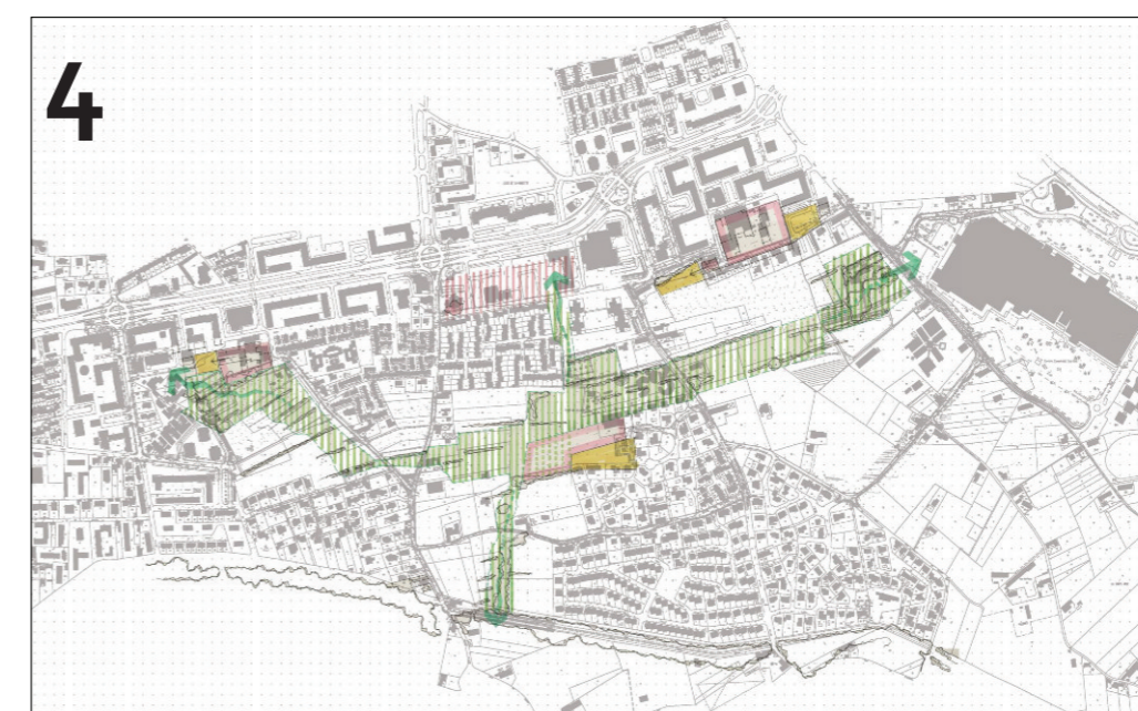
La spécificité de Joly Jean sera l'espace vert central

Favoriser les accès aux transports en commun existant et futur tramway, un projet en lien avec les quartiers existants.