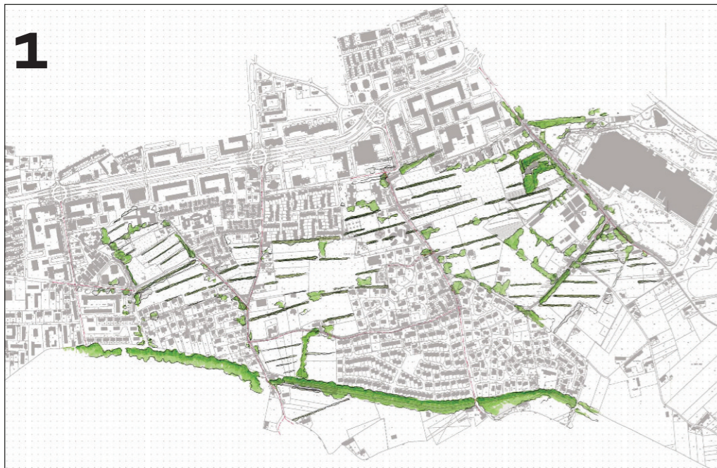
Dans la trame des haies, le projet s'intègre dans la trame foncière agricole existante.

La trame parcellaire agricole historique a été malmenée par les grandes opérations d'urbanisme des 50 dernières années. Le projet se développe dans la trame des haies et sur ce parcellaire étroit si particulier et typique.