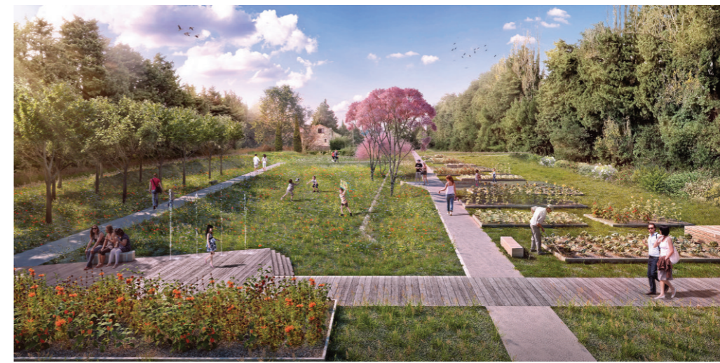
Vue sur les potagers perpétuels et prairie hydraulique

La voiture à sa juste place! pas de circulation de transit pour préserver la tranquillité des résidents. Rabattement des flux vers les carrefours existants.