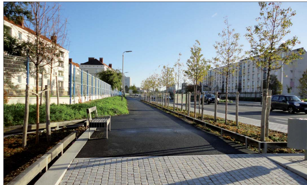
Trottoir nord à l'approche du carrefour Sémard-Pressensé