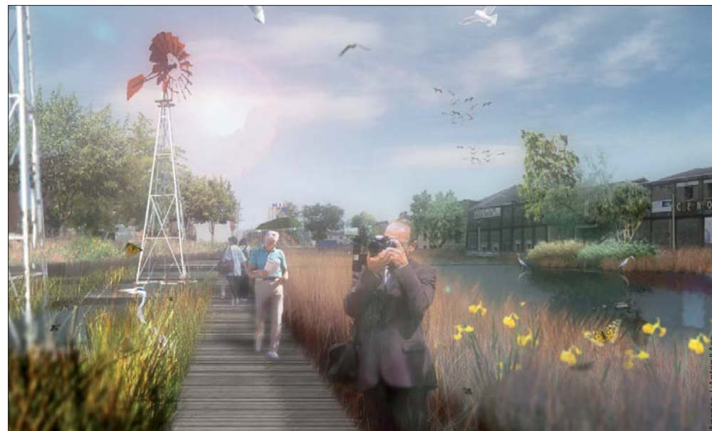
Les futurs bassins au coeur du parc des Docks alimentés par les eaux épurées de voirie et la nappe

Agence L'Anton & Associés - dossier de références