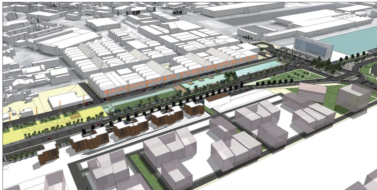
Vue globale sur le futur parc des Docks face aux magasins généraux, développement de la ville au nord et la CCI-bassin Vauban