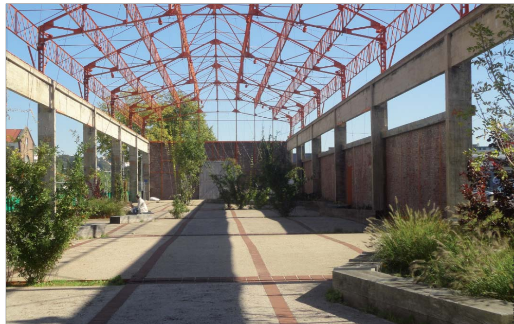
Ancienne halle industrielle transformée en square de proximité le long de la promenade