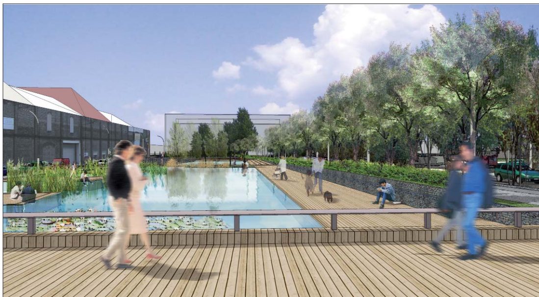
Vision depuis la passerelle principale du parc dans l'axe de la CCI après démolition de l'échangeur actuel