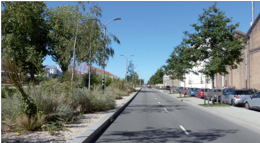
Les plantations du trottoir, terre-plein central et noue le long de la voirie principale