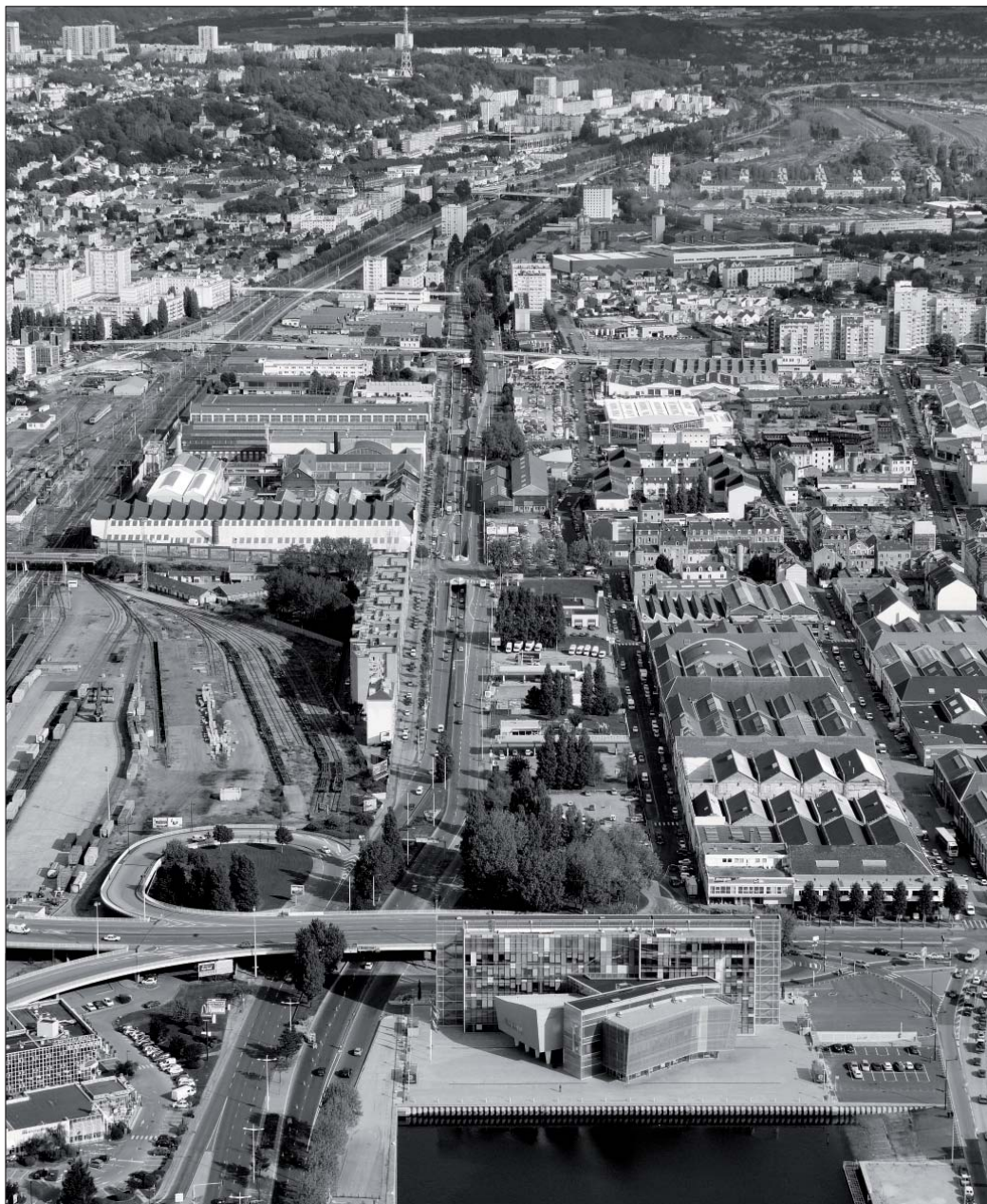
Vue de l'entrée de ville actuelle

1er Prix du Concours National des Entrées de Ville 2011