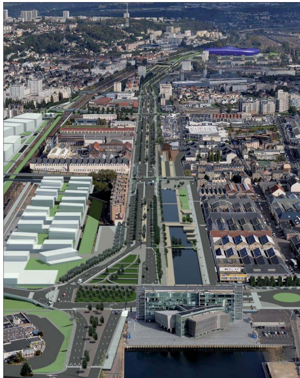
Vue de l'entrée de ville projet