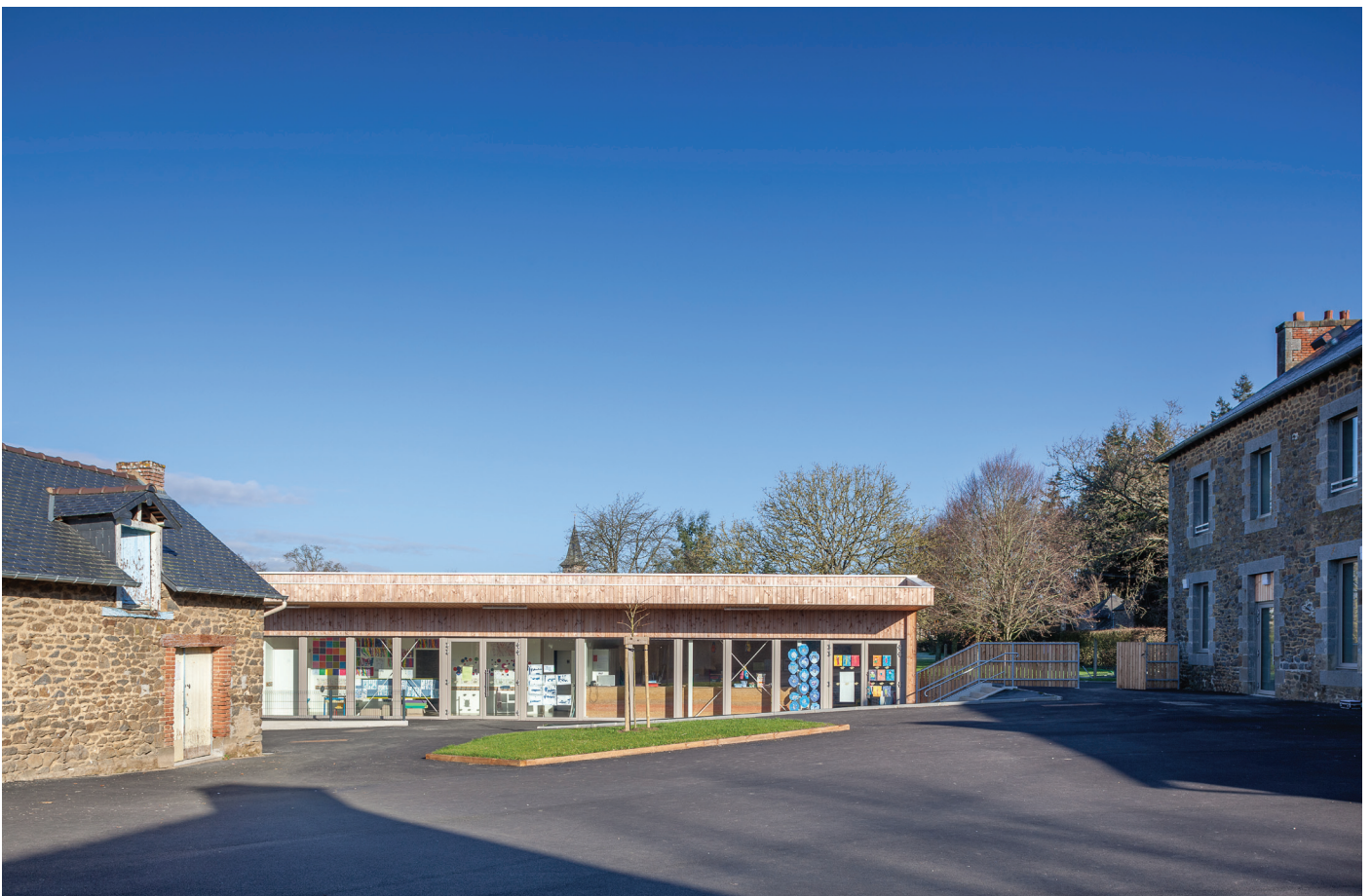
Intégration du bâtiment d'extension dans la cour Maternelle

La réhabilitation de l'ancienne école-mairie a été réalisée lors de la seconde tranche de travaux. Les extensions annexes au bâtiment existant ont été démolies afin de retrouver l'aspect initial du bâti et de la pierre granitique. En lieu et place des anciennes salles de classe, l'ensemble ancien abrite désormais les activités périscolaires, avec notamment une cuisine et une salle de restauration, ainsi qu'une garderie avec un accès indépendant au groupe scolaire.