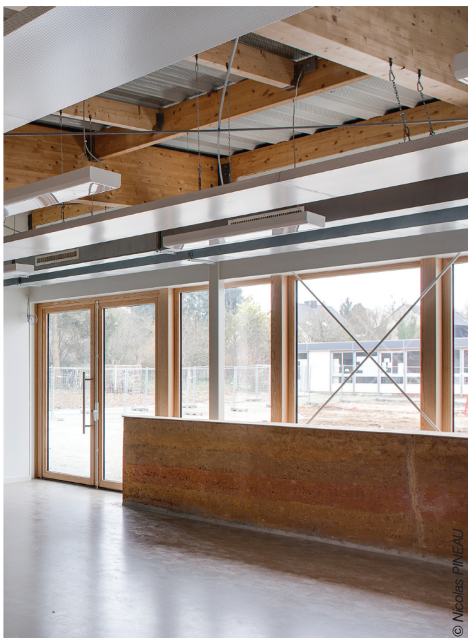
Salle de classe - mur en terre Sud