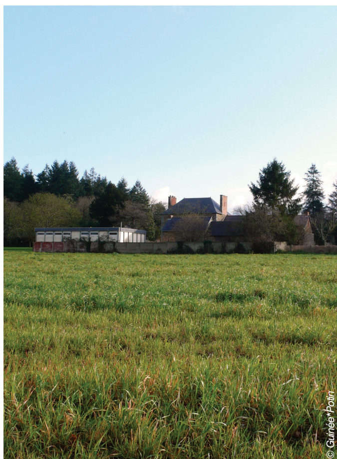
Vue du groupe scolaire avant travaux depuis l'Ouest

La tranche 1 prévoit l'extension du groupe scolaire par la création de 2 classes élémentaires et d'un préau, de sanitaires correspondants, d'un aménagement d'une cour de récréation pour les élèves d'élémentaire, ainsi que le réaménagement du jardin pédagogique. La tranche 2 consiste à poursuivre la construction du bâtiment neuf, avec l'ajout de deux classes maternelles, d'un dortoir et de sanitaires enfants. Cette seconde tranche de travaux comprend la démolition des préfabriqués, de l'annexe chaufferie et local enseignants, et la réhabilitation du bâti ancien pour y loger la garderie, la cuisine, et la salle à manger. La cour de récréation actuelle est également réaménagée, ainsi que les abords et le parvis d'entrée. Des accès plus lisibles ont ainsi été créés;