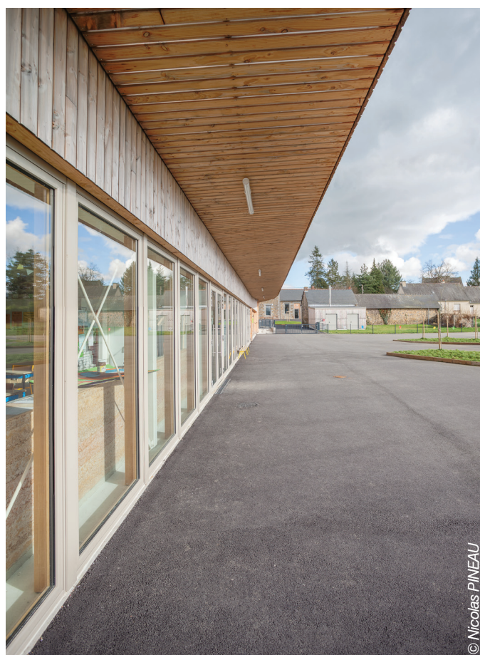
Vue d'ensemble du projet depuis l'extrémité Ouest de l'extension