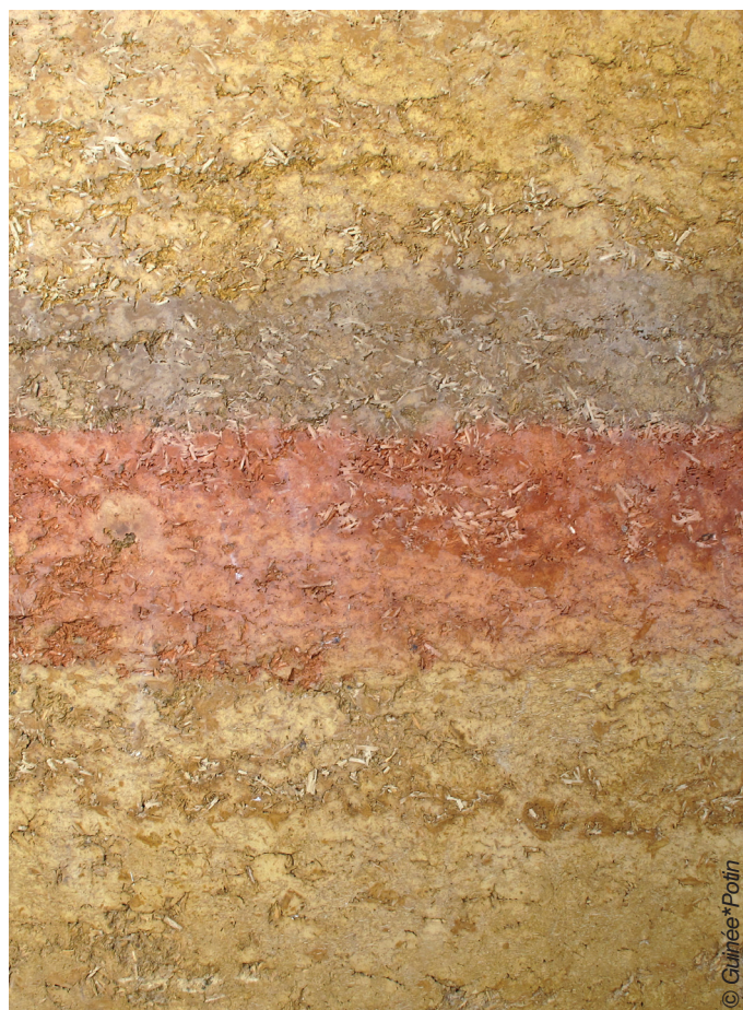
Détail du mur en terre