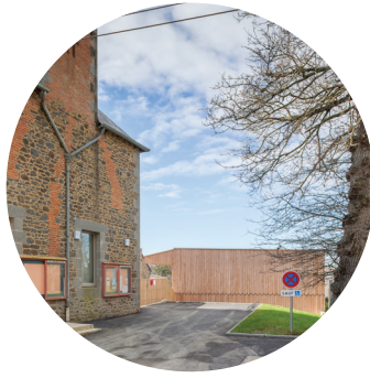
lisibilité de l'accès