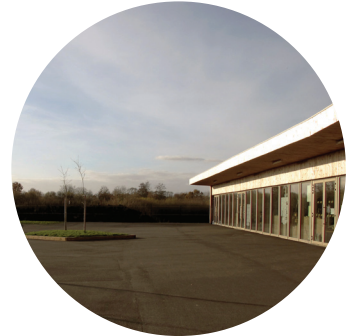
une école ouverte sur le paysage