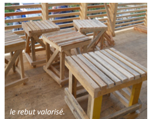
le rebut valorisé.