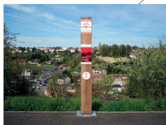
Ligne Foulon-Clémenceau ( 1h 15mn )