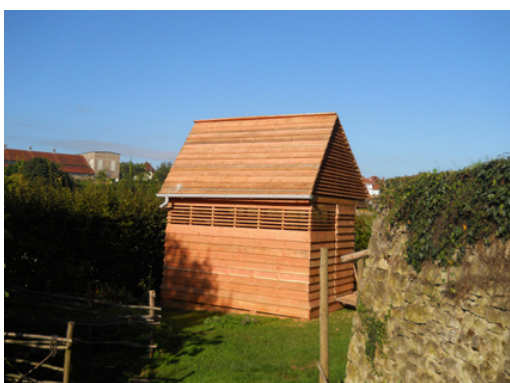
La «Folie» des Jardiniers (2014)

Valoriser un paysage extraordinaire en réalisant des constructions simples et adaptées aux usages apparaît aujourd'hui comme une évidence dans le paysage actuel de Briey.