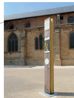
Ligne Vieille-Ville ( 1h )