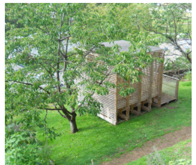
Les sculptures en bois, posées sur les terrasses au coeur du Parcours : une invitation à découvrir la diversité paysagère de Briey.