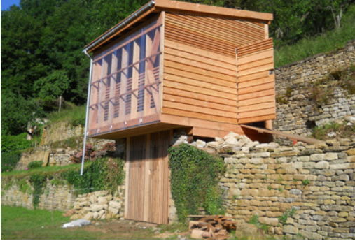
La «Folie» des murailleurs (2016)