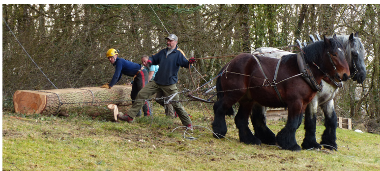
Débardage et travaux par des chevaux plutôt que par des engins