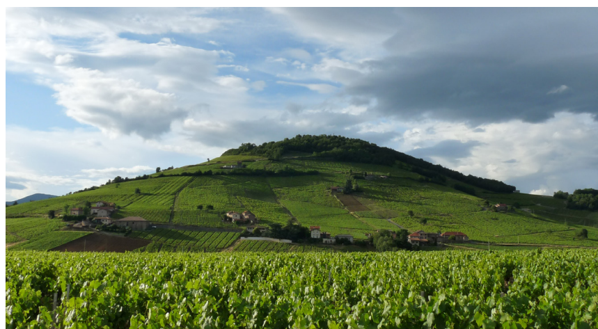
Le Mont Brouilly, une silhouette marquante des paysages du Beaujolais