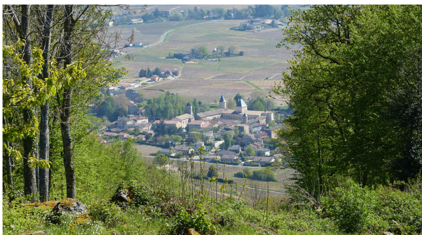
Percée forestière vers le village de Saint-Lager