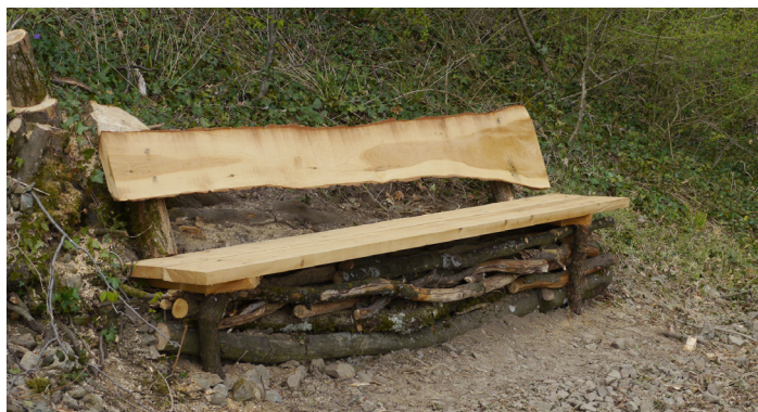
Un banc créé à partir de coupes de petits bois et chutes de sciage

Loin l'idée de livrer un aménagement fini. Le projet de mise en valeur du Mont Brouilly, peu coûteux en investissement de départ, s'inscrit dans la durée et modifie le mode d'intervention du concepteur. Chaque année la gestion du site naturel, génératrice de matière, est l'occasion de nouveaux chantiers collaboratifs permettant de réajuster la composition initiale, de renouveler des ouvrages éphémères et d'animer le site par de nouveaux aménagements.