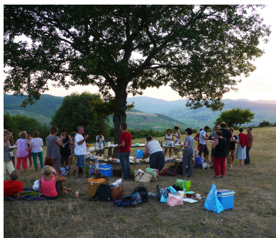
Pique-nique autour d'un banc face à la vue dégagée