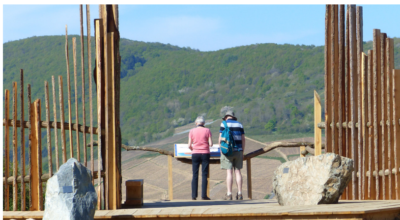
Le bois issu des abattages est scié sur place et permet la construction d'ouvrages tels que les belvédères