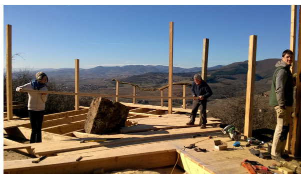
Chantier participatif de construction d'un belvédère