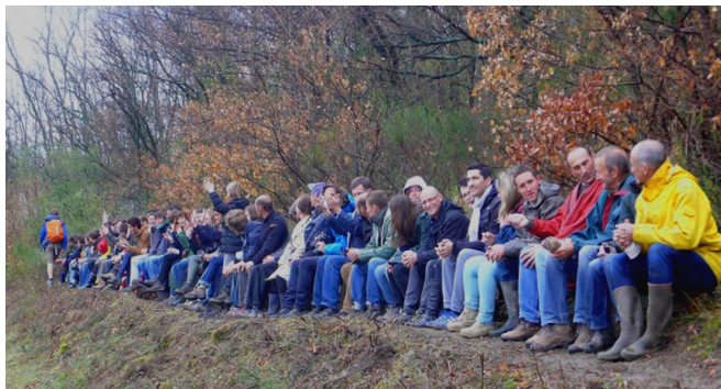
Démarrage du projet : un atelier étudiant de l'ENSP Versailles

L'aménagement a été conçu et réalisé en accordant une grande importance aux chantiers, des moments pédagogiques, fédérateurs et conviviaux. Suite à l'esquisse, les paysagistes troquent la casquette de concepteur pour celle de conducteur de travaux : ils animent des chantiers au cours desquels professionnels, employés communaux, personnel en réinsertions, étudiants, habitants et vignerons bénévoles se rencontrent, échangent et co-construisent le projet. Traction animale, sciage mobile et récompense des bénévoles par du bois favorisent une économie durable et circulaire.