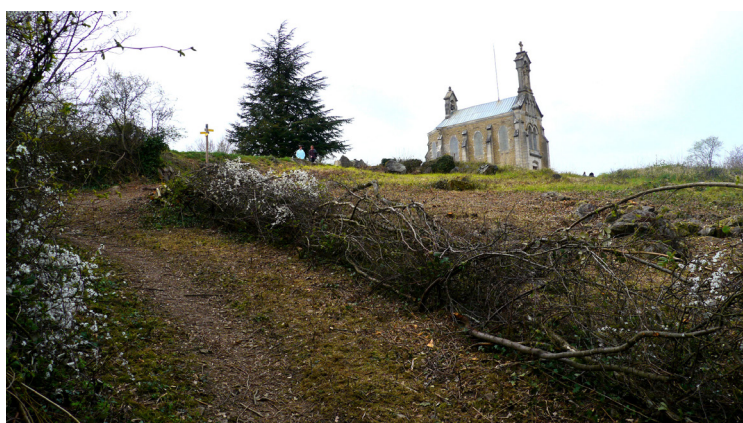
Le plessage d'arbustes en place permet la création d'une haie