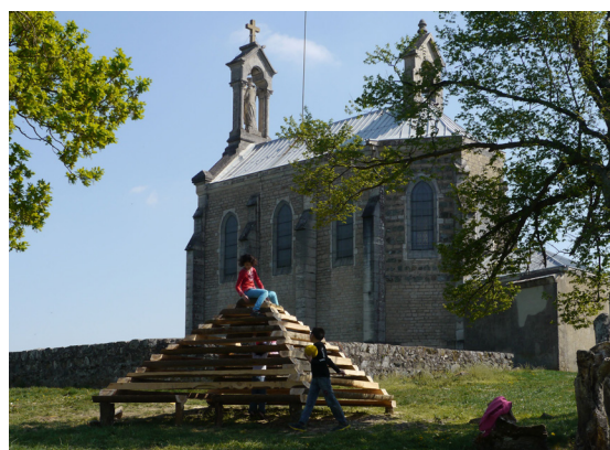
Pyramide de jeux en cèdre et robinier