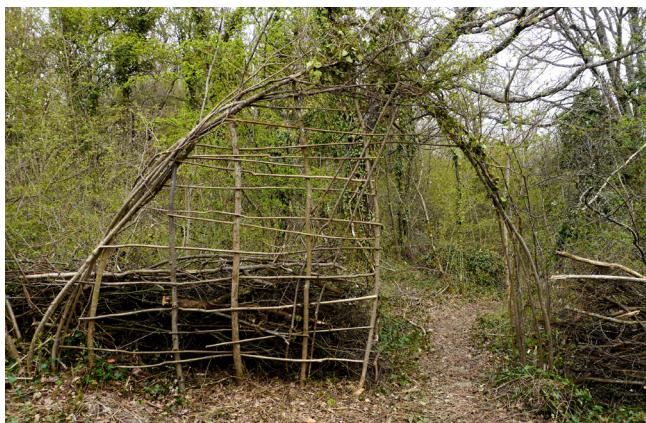
La porte d'entrée du clairière en branche tressées