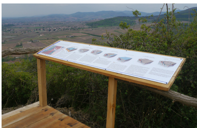
Support d'interprétation de la géologie et du paysage