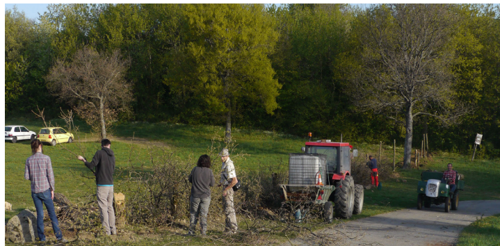
La fédération de chasse invitée à un chantier de plantation en 2016