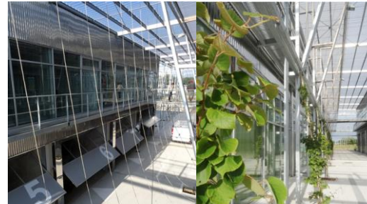
Écopole Périgord Aquitaine Duncan Lewis architecte

Liaisons douces à l'échelle du site et accessibilité aux transports en commun (tram / train) à la gare de Blanquefort, sur site.