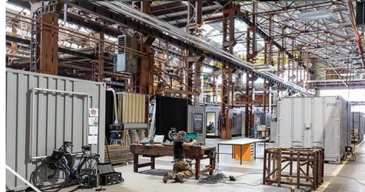
RDM à Rotterdam