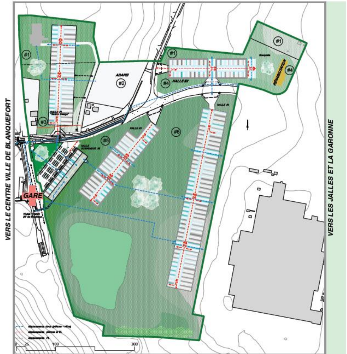
un sol continu planté de halles monuments