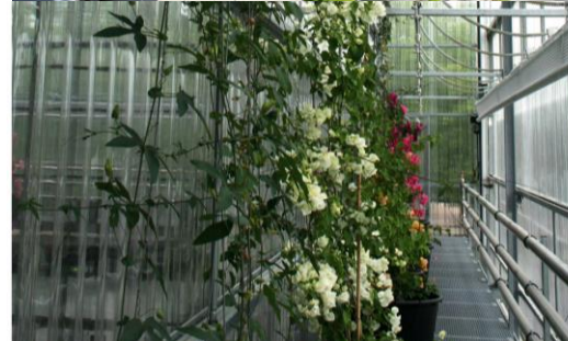
Halle Nord de Villepinte A. Lacaton & J. P. Vassal architectes