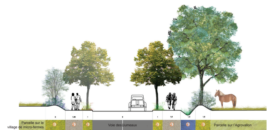
Coupe (a) : La voie des jumeaux