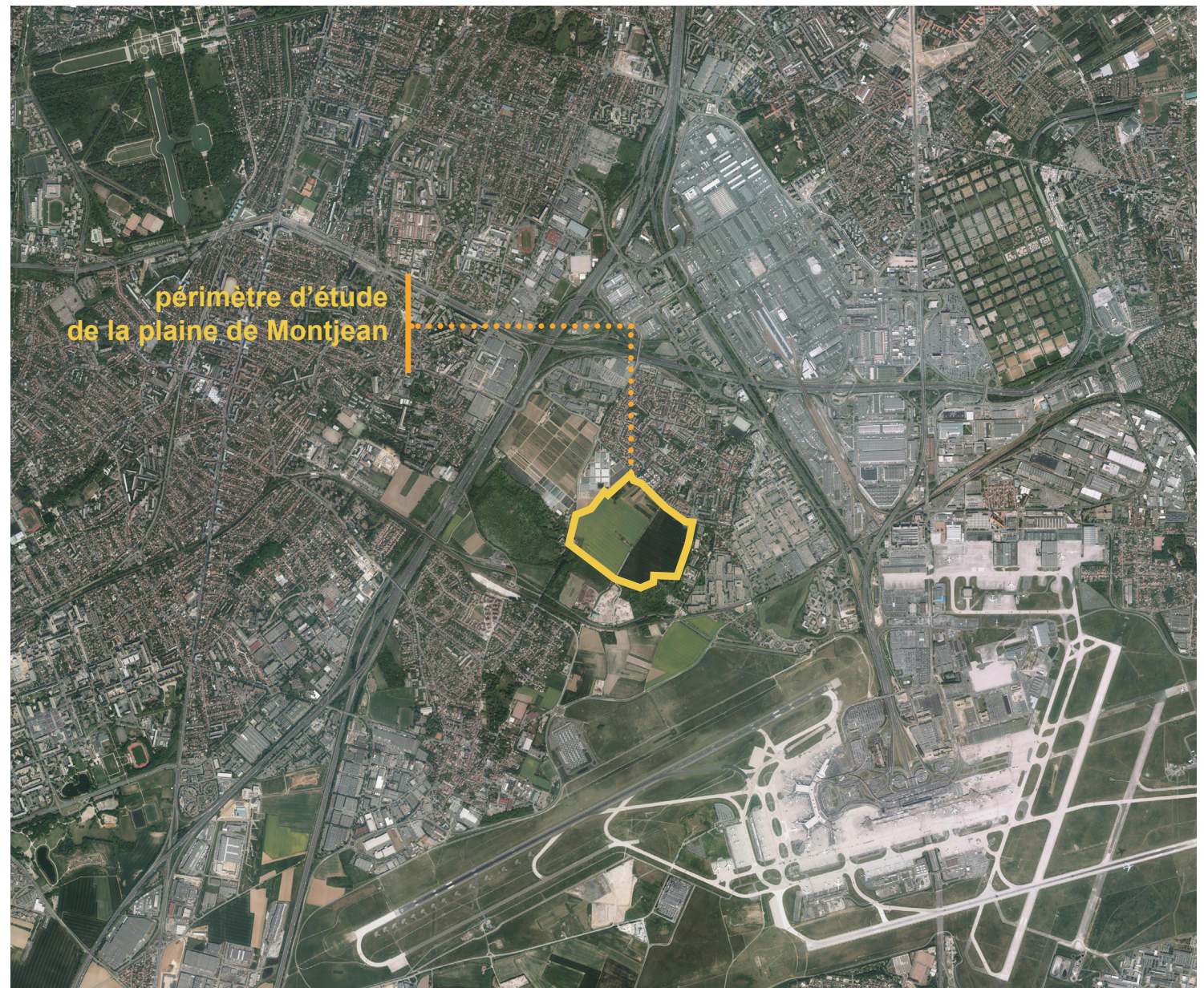
La Plaine de Montjean dans son contexte urbain élargi.