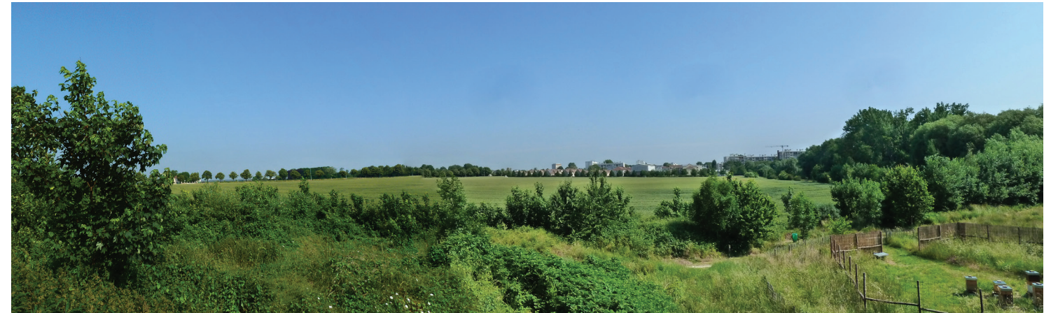
Vue panoramique de la plaine depuis le Sud, avec la ville de Rungis en arrière plan.

Maîtrise d'ouvrage : Agence des Espaces Verts d'Ile de France Équipe : SAFER mandataire, Agence L'Anton, Burgeap, Biodiversita, La Ferme du Bec Hellouin Mission : Étude de programmation Programme : Parc agricole de fermes bio-intensives. Coût de la mission : 69 K€ HT Superficie : 38.2 ha Coût des travaux : 8 M€ HT Date : 2015