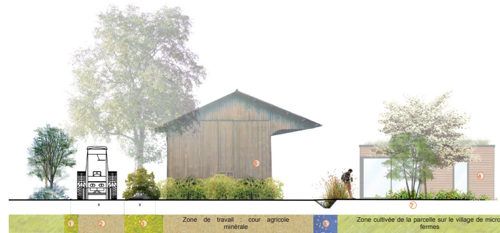
Coupe (c) : Chemin d'exploitation et bâtiments agricoles