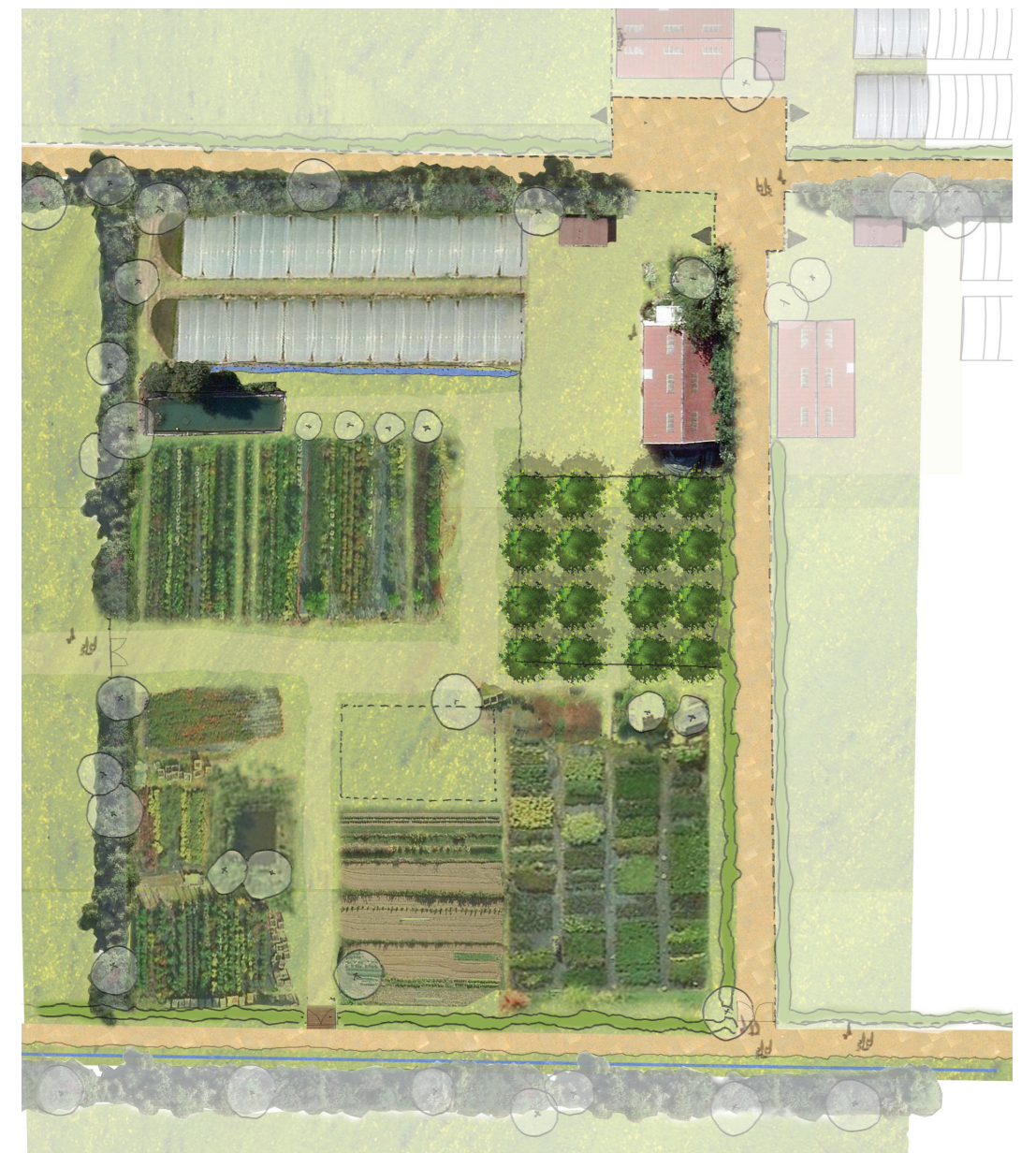
Plan masse d'une parcelle type de micro-ferme.