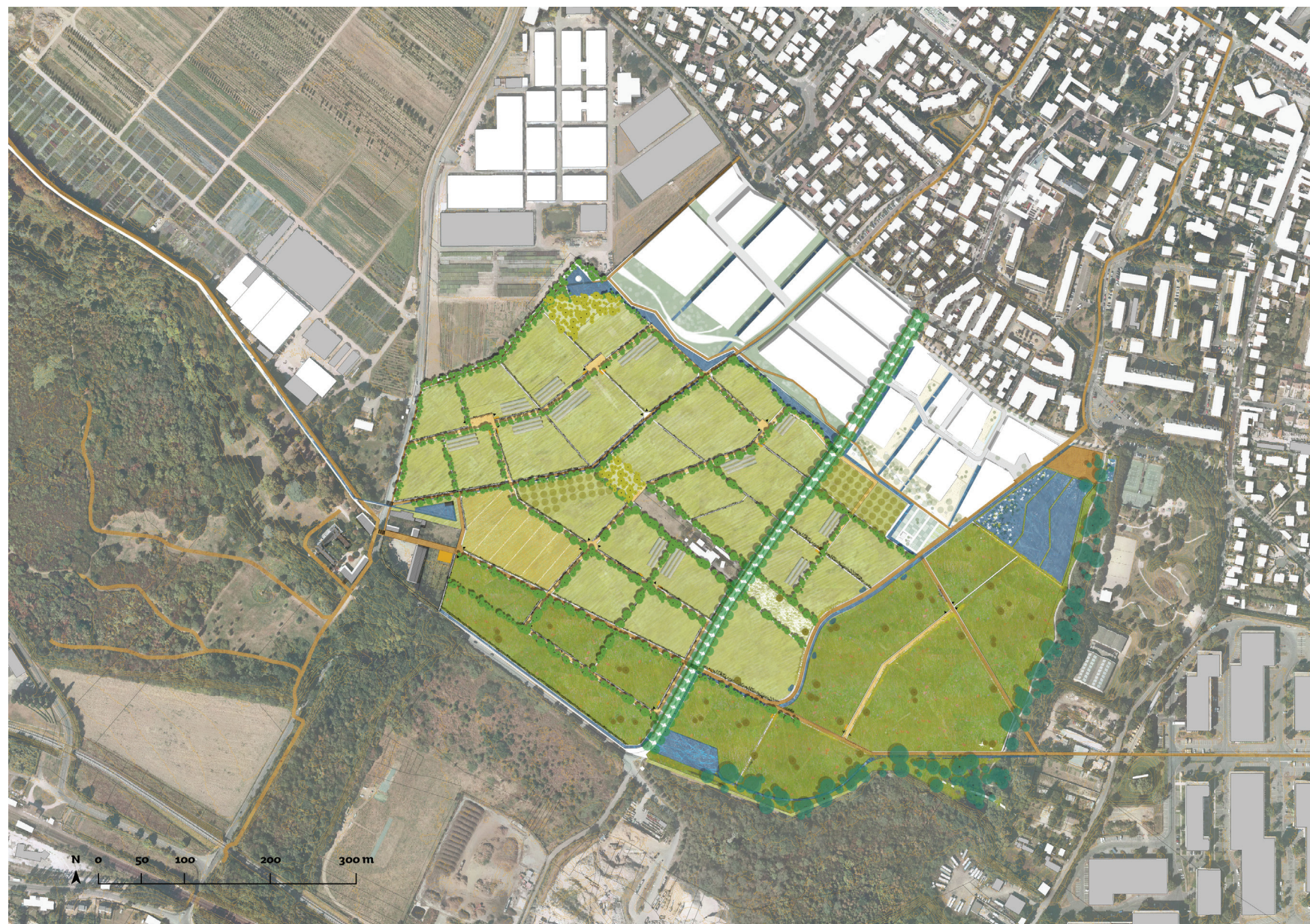
Plan masse de programmation.