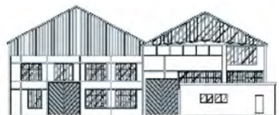
La transformation de la halle 35