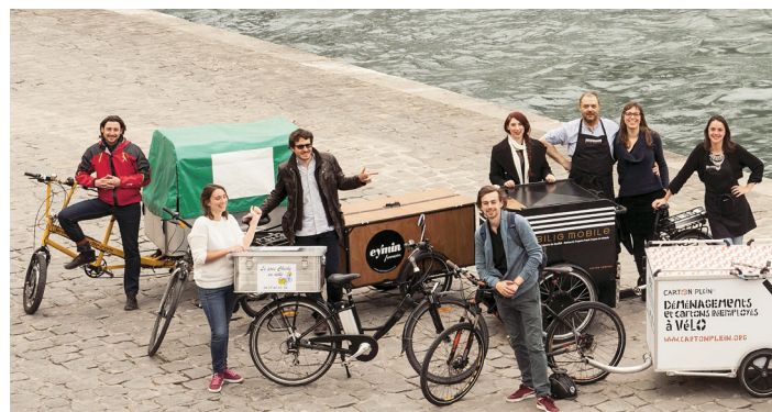
Les Boîtes à vélo