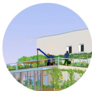
Culture en toiture