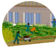
Potager de permaculture

Une communauté qui rassemble étudiants et personnes en insertion autour d'une même activité