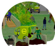
Compost électromécanique et manuel

Un équipement inclusif au service des habitants du quartier