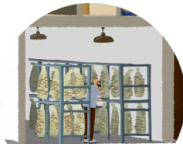
Culture de champignons