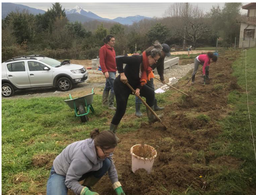
3.2 Plantation haie - action collective et participative © cosma architecture