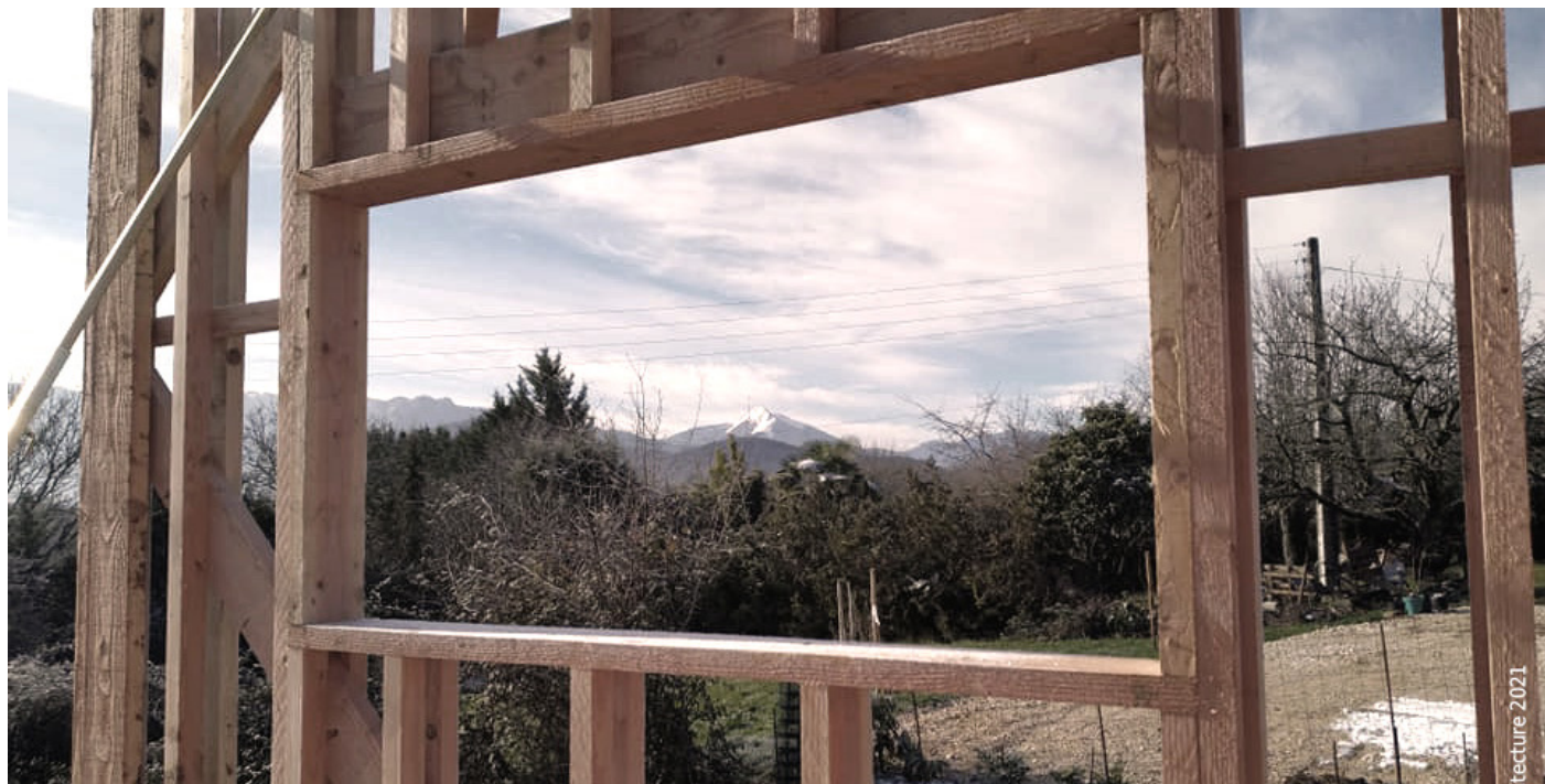
2.1 Cadrage du paysage avec des larges ouvertures © cosma architecture

CONCEPTION ARCHITECTURE SOBRE POUR REVENIR À L'ESSENTIEL