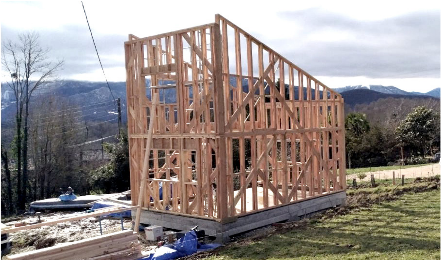
4.1 Ossature bois © cosma architecture