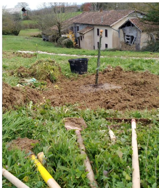
3.3 Plantation arbres © cosma architecture