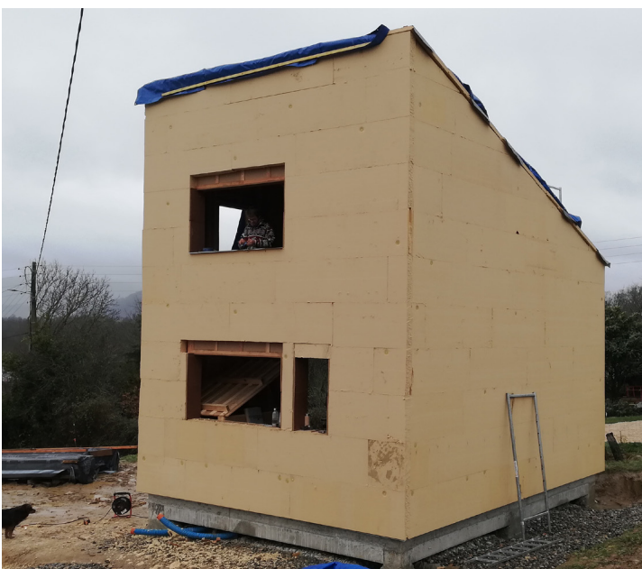
4.3 ITE fibre de bois sur ossature bois © cosma architecture