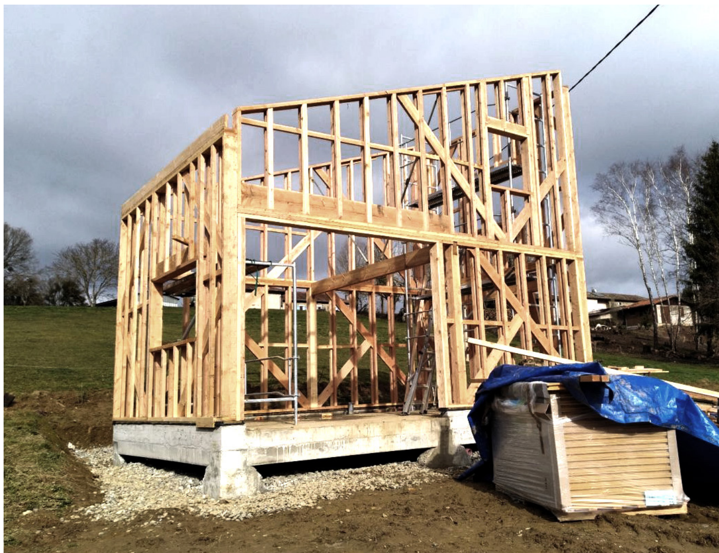
2.2 Vue de la structure bois qui va recevoir l'isolation en fibre de bois extérieure et la terre chanvre projetée