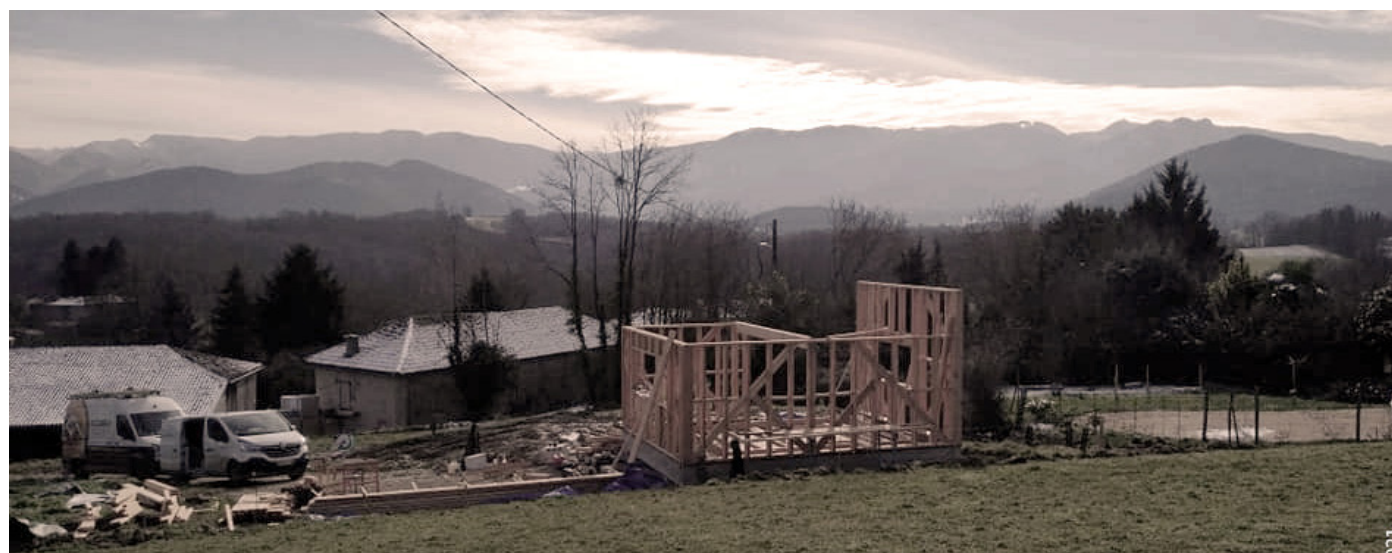
3.4 chantier © cosma architecture