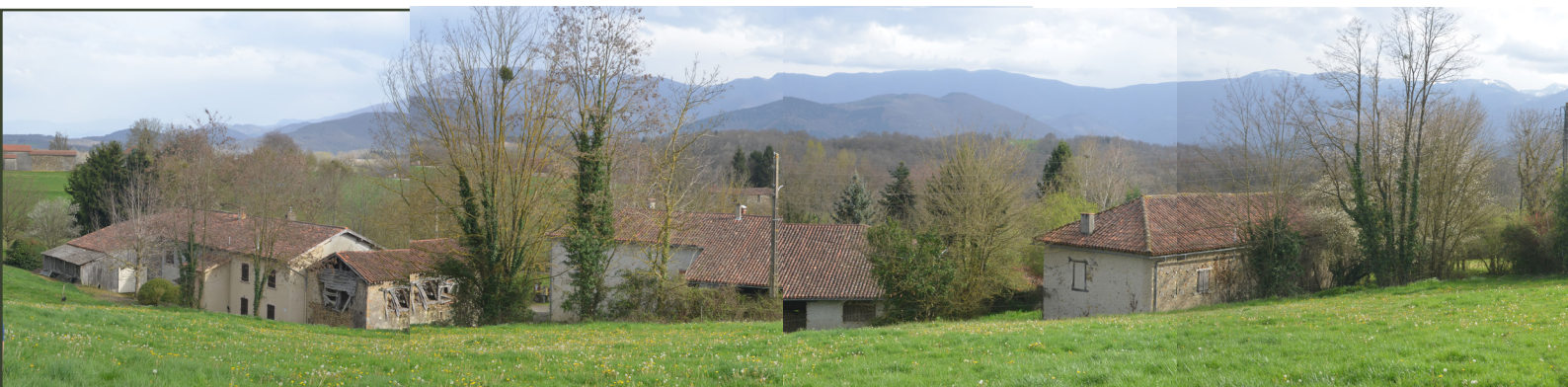
1.1 Vue depuis le terrain d'implantation avant les travaux

TECHNIQUE: Ossature bois, isolation mixte des murs en terre chanvre projetée (intérieur) sur fibre de bois (extérieur)