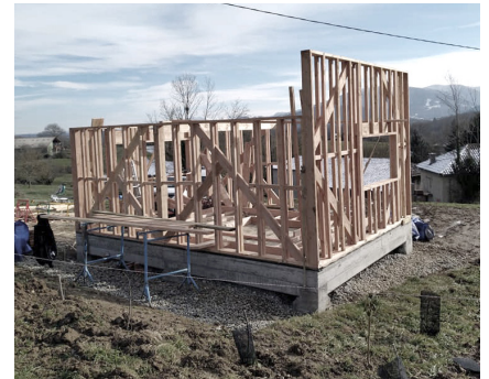
4.2 Fondations, dalle béton hourdis, élévation ossature bois © cosma architecture