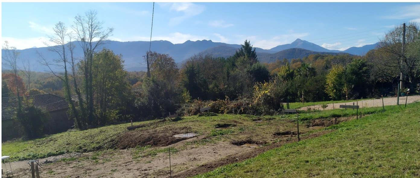
3.1 Assise sur terrain à mi-pente et fondations par plots © cosma architecture

AMÉNAGEMENT PAYSAGER ENTRE RESPECT ET MISE EN VALEUR