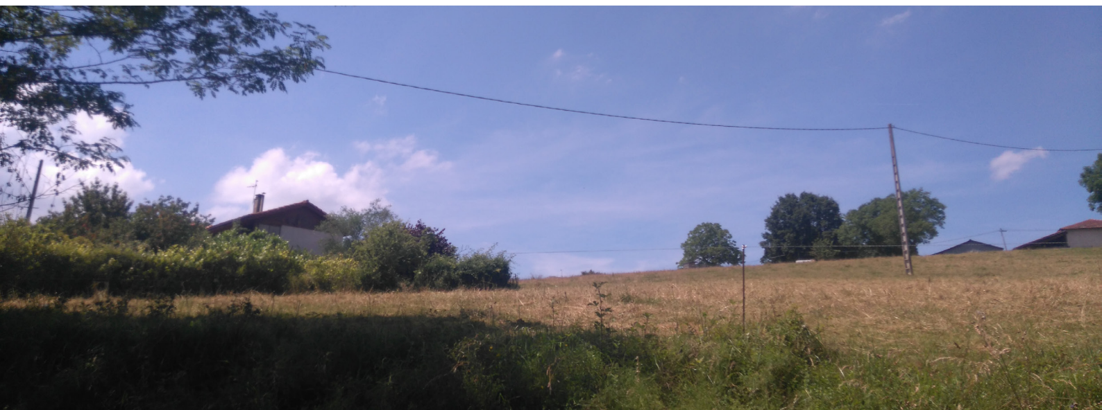
1.2 Vue vers la zone d'implantation avant les travaux