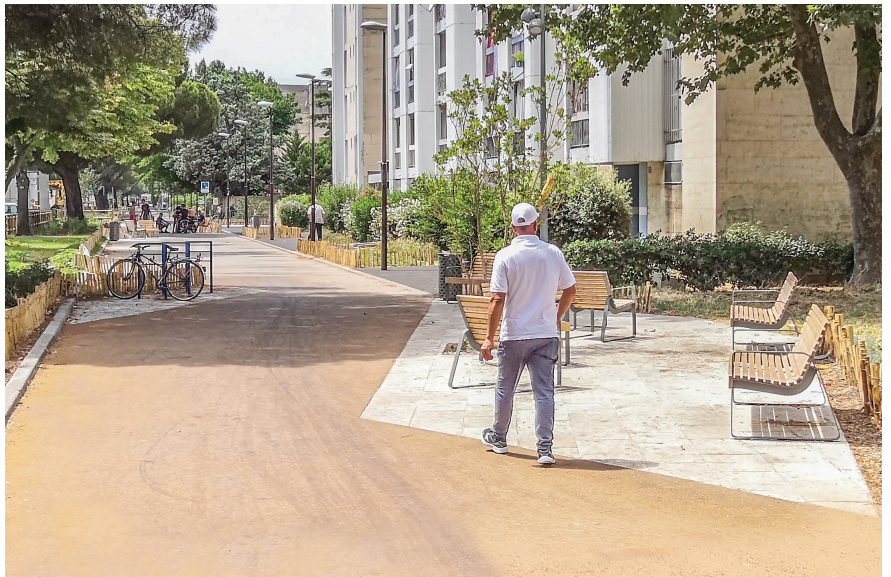
Avignon Voie Verte : réemploi des pavés et dallages de la rue Carreterie | Mai 2020