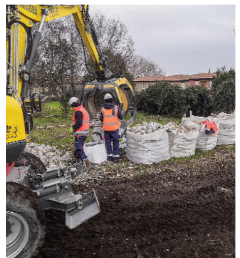
Tri et opérations de nettoyage des pavés et dallages | Janvier 2020