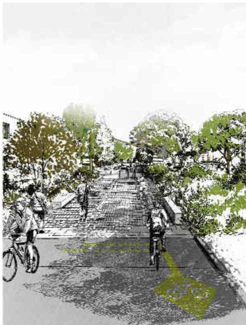
Aménagement ponctuel en salon urbain