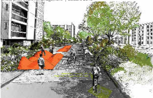
Aménagement ludique ponctuel