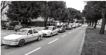
Contre allée de la Rocade Charles de Gaulle : La voie verte avant travaux | 2018