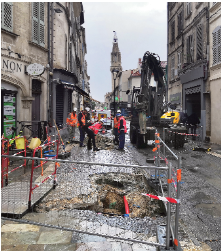
Avignon | Aménagement rue carreterie : récupération matériaux | Sept 2019