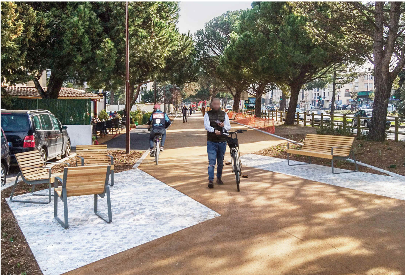
Renforcement végétal et jalonnement signalétique

De même, le programme s'inscrit dans les grands objectifs d'aménagement portés par la commune pour répondre aux enjeux sociaux et urbains, notamment en matière de mixité fonctionnelle, d'amélioration du cadre de vie, de cohérence des traitements des espaces publics et de démarche de développement durable et d'apaisement des espaces.