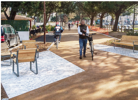
La voie verte après travaux | Mars 2020