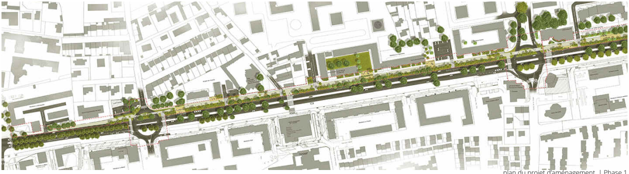
plan du projet d'aménagement | Phase 1