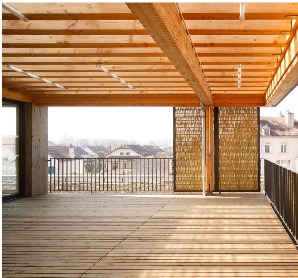
Maison de la rivière Terrasse à l'étage en ossature et platelage bois