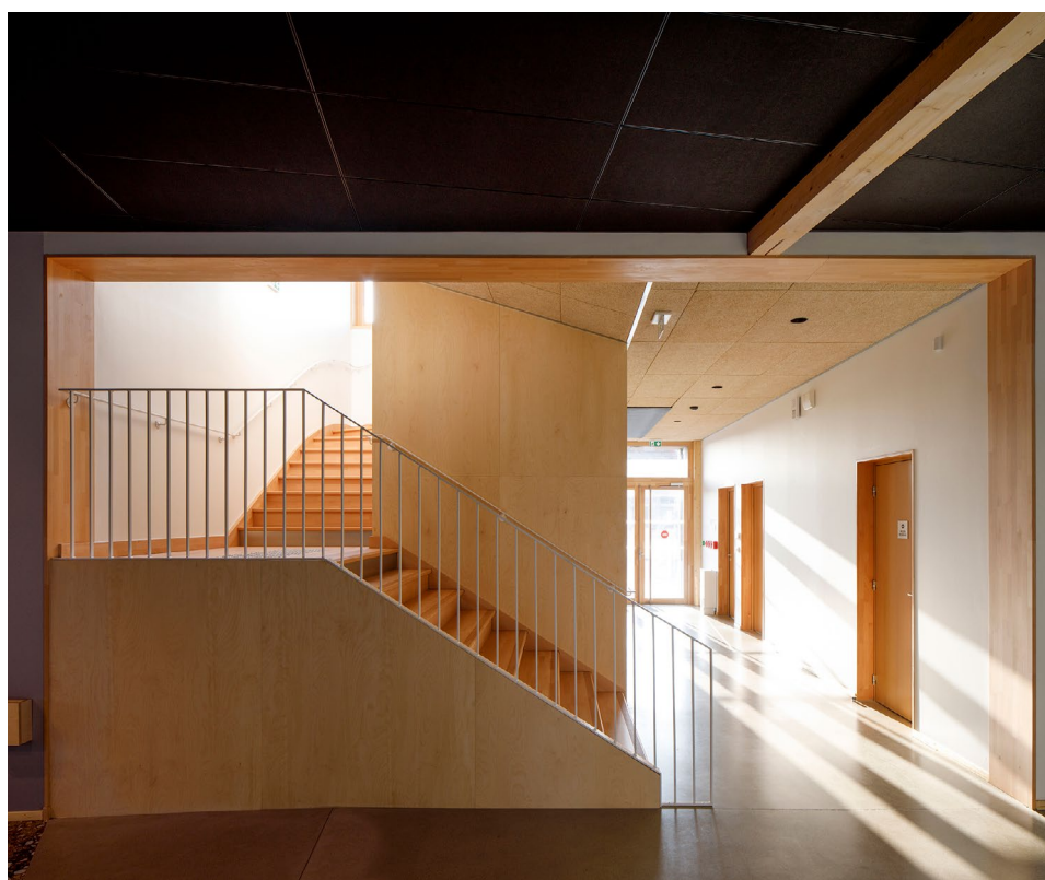
Maison de la rivière Vue intérieure, escalier bois donnant accès à la terrasse