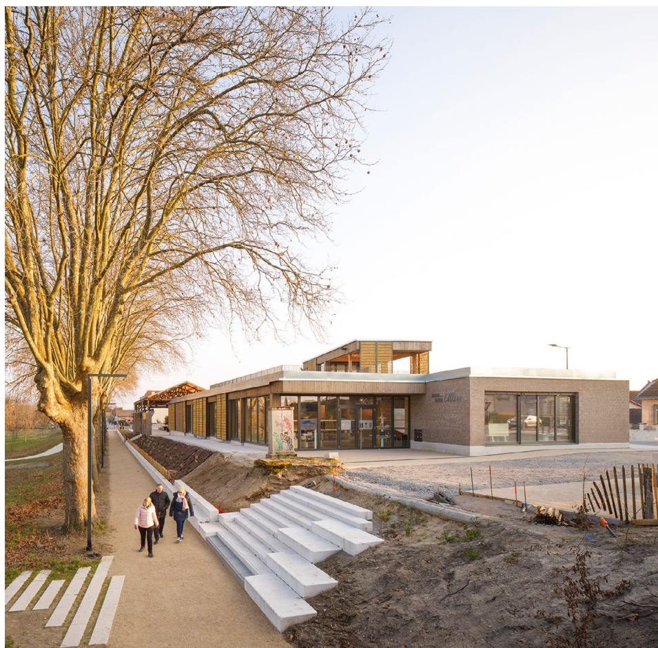
Maison de la rivière Vue de l'entrée principale et de la promenade le long des berges d'Allier