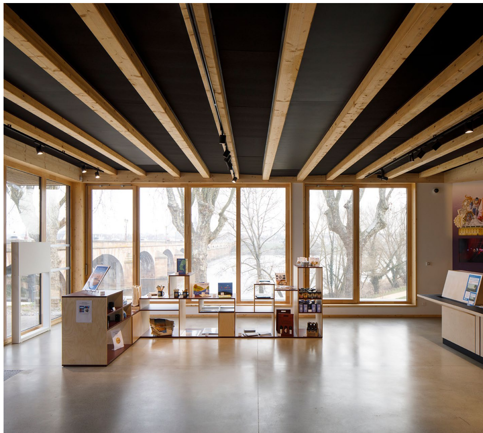
Maison de la rivière Hall principale du CIAP (Centre d'Interprétation de l'Architecture et du Patrimoine) avec ses larges ouvertures sur la rivière et le centre ville de Moulines