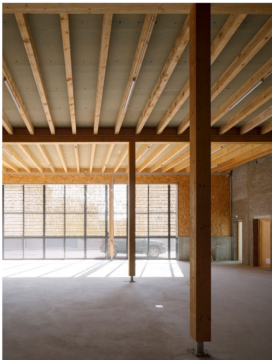
Base nautique Garage bateaux avec fermeture en panneaux osier